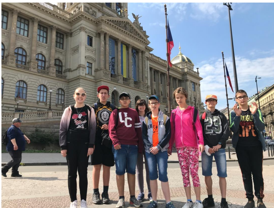
Národní muzeum Praha