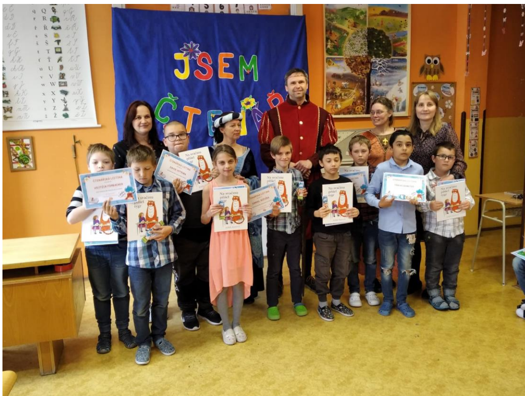
Pasování na čtenáře