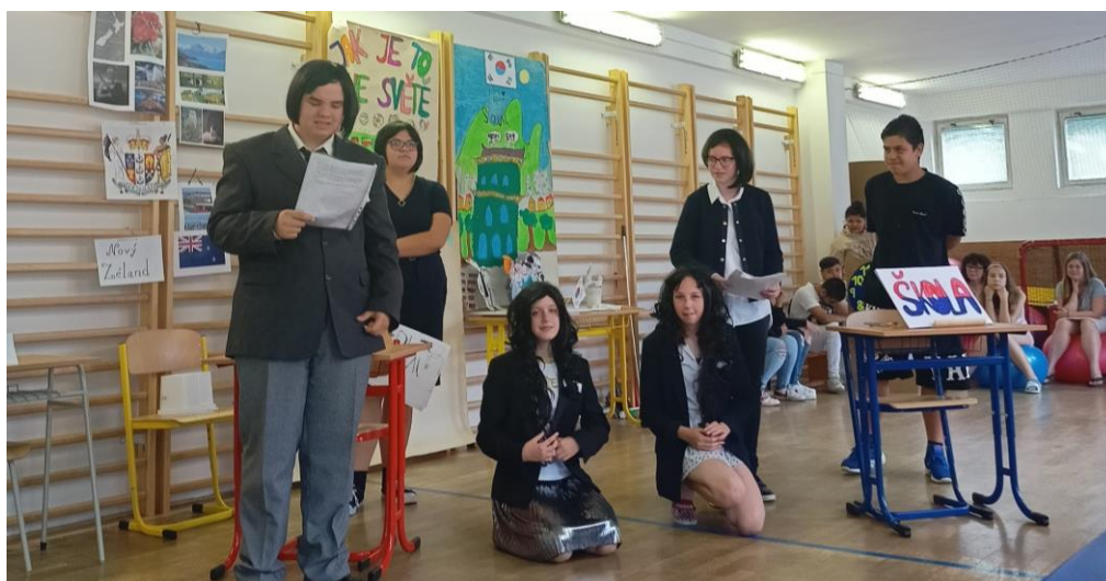
Jak je to ve světě