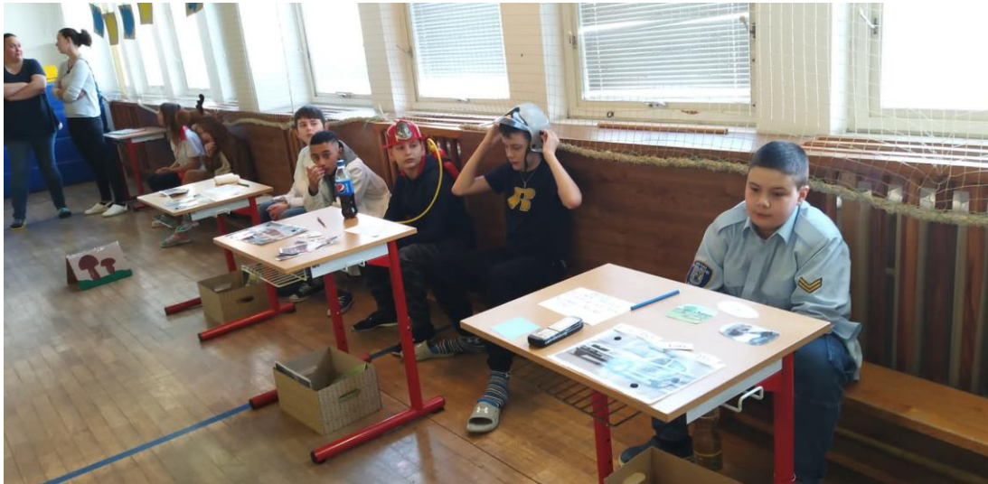
Škola v přírodě Karlštejn