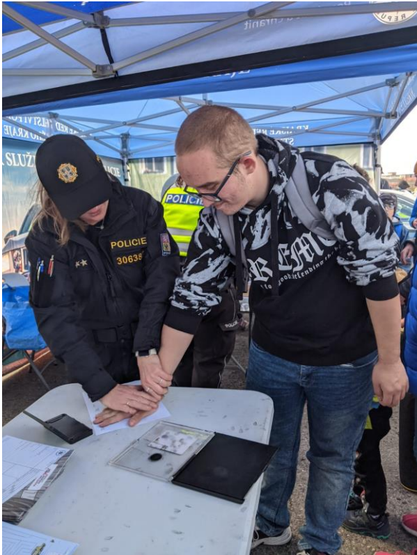
Velká cena Hořovic