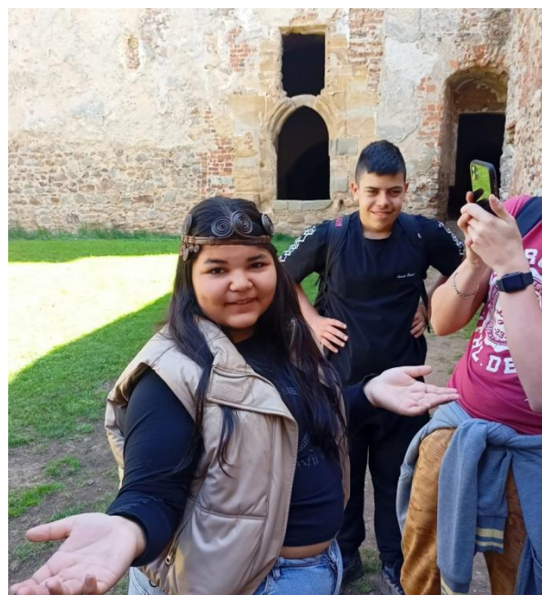
Mamuti na Točniku