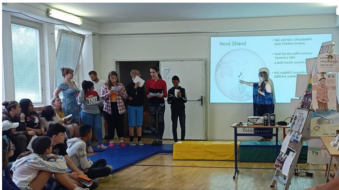
Jak je to ve světě