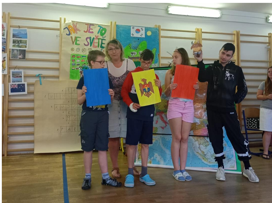
Jak je to ve světě