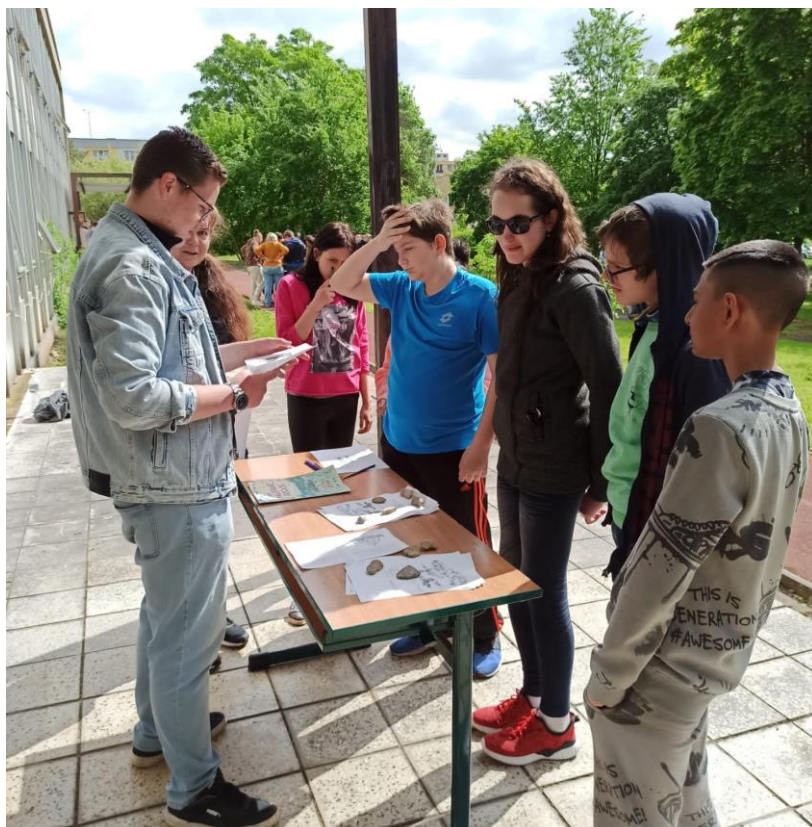
Příroda nás baví