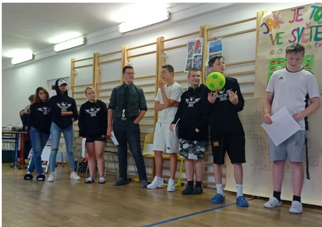
Mamuti na Točniku