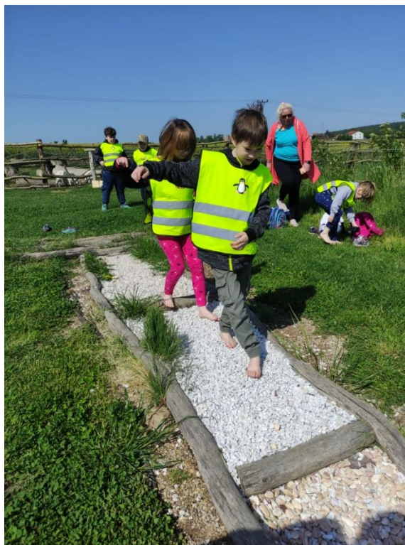
Statek u Merlina