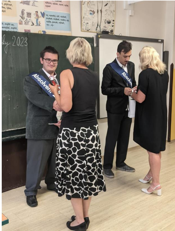
Závěrečné zkoušky v PŠ