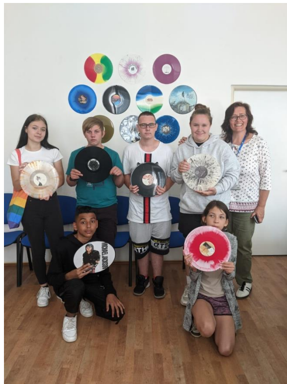
Návštěva GZ Loděnice